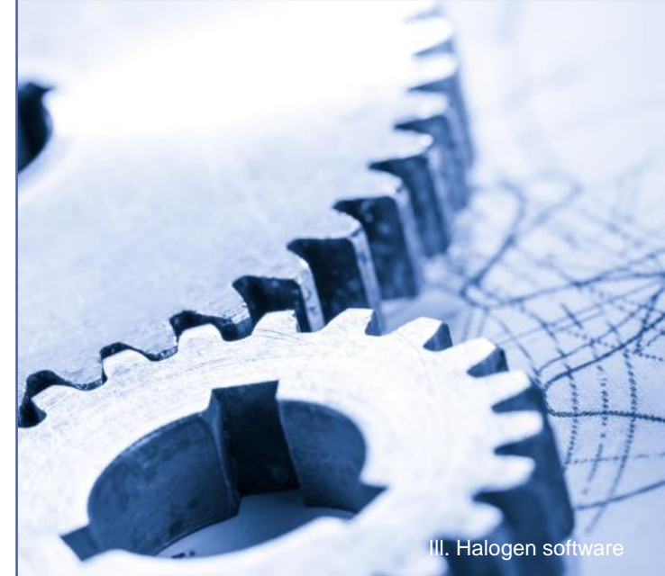
III. Halogen software