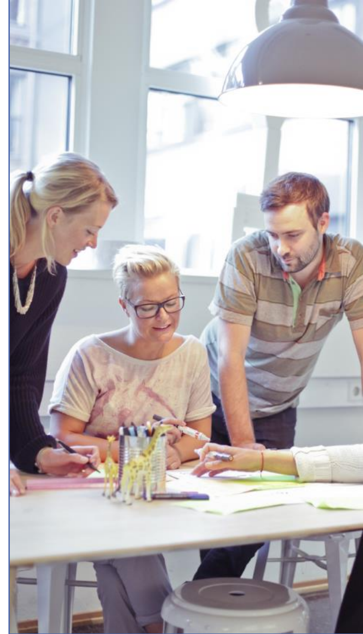
Minsk